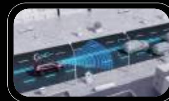
Asistente de atascos de tráfico (TJA)