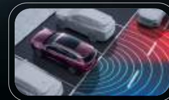
Alerta de tráfico cruzado (RCTA)