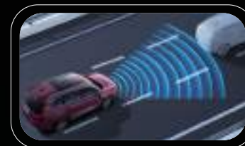
Control crucero adaptativo (ACC)