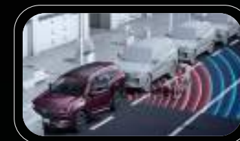
Advertencia de apertura de puerta (DOW)

*Imágenes corresponden a la versión Tiggo 8 PRO PHEV