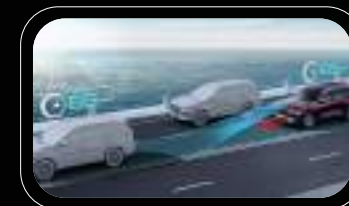
Asistencia de crucero integrado (ICA)