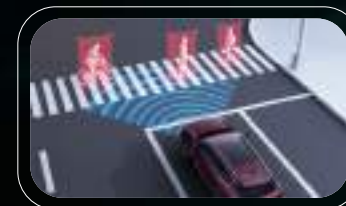
Advertencia de colisión frontal (FCW)