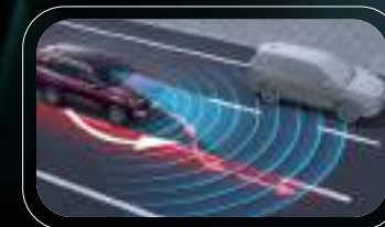
Advertencia de cambio de carril (LDW)