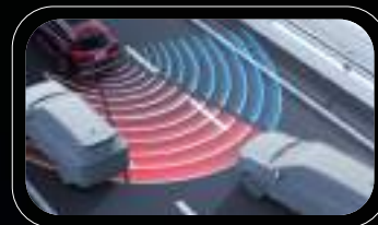
Monitoreo de punto ciego (BSD)