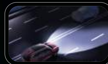
Control inteligente de luces altas (IHC)