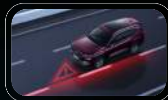
Asistencia de cambio de carril (LKA)