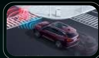
Sistema de frenado de emergencia (AEB)